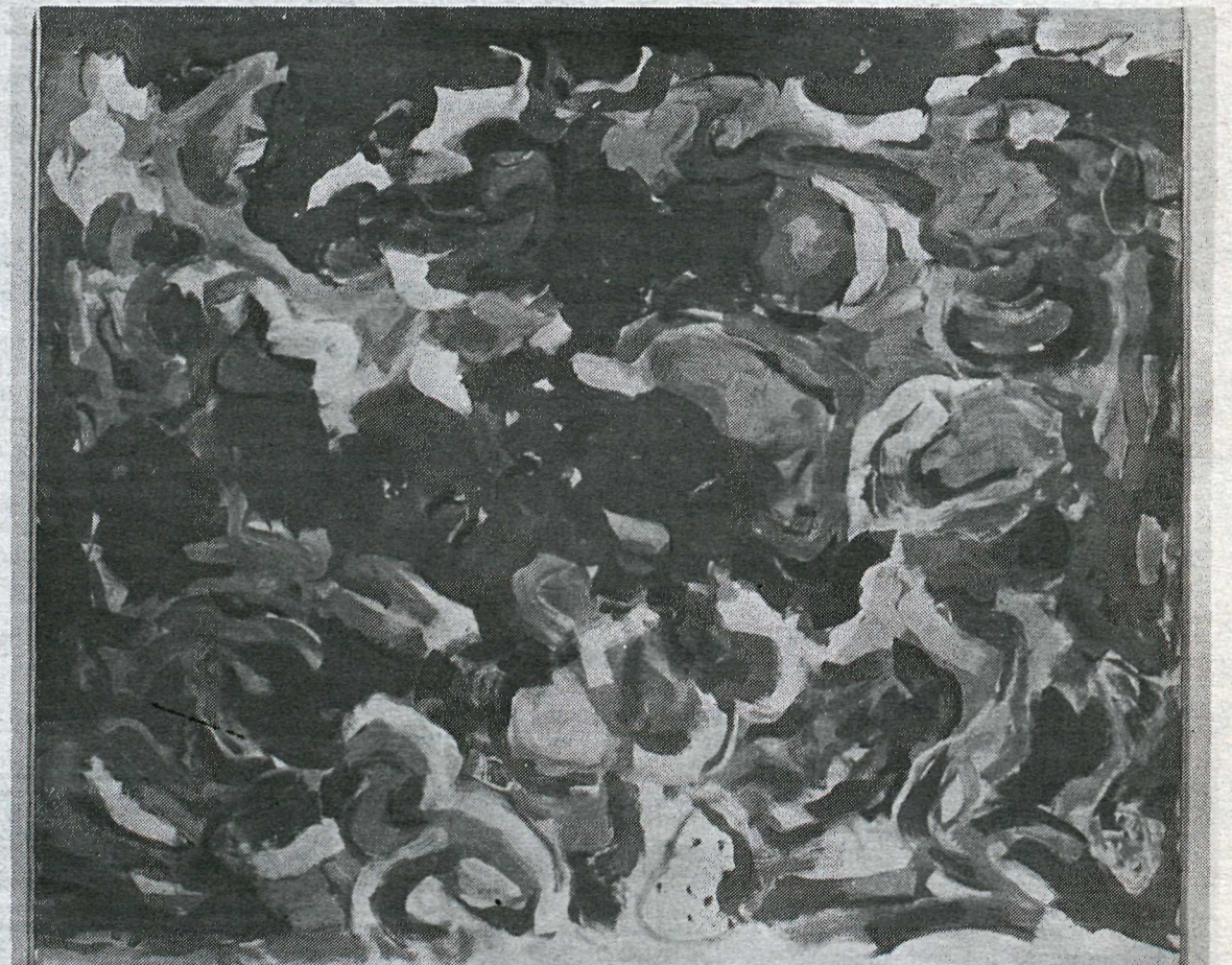
Rauðasandsríma '82 eftir Kristján Davíðsson. Hér grundvallast málverkið á samhljómun lita og óendanlegri hreyfingu sem listamaðurinn gefur ákveðið streymi.

beislúð á myndfletinum. En við það skapast ákveðin spennu milli hringformanna eða milli hringformanna og boglínanna sem umleika þau. Þessi spennu er síðan mögnuð með því að „lýsa upp“ litinn umhverfis línur og form. Þannig framkallast viss „vibration“ sem þó er ávallt hugvitsamlega beislúð. Þessi seria gaf áhorfendum gott tækifæri til að kynna fjölda úrlausna á einni formhugmynd.