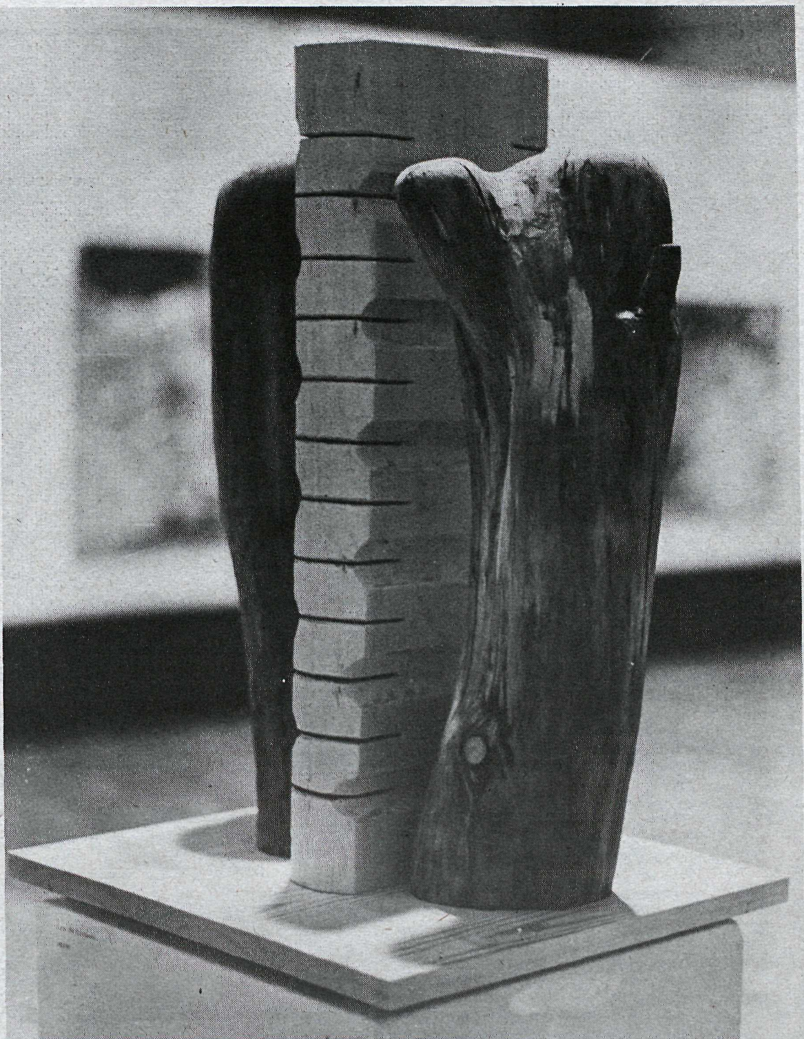
Múrinn eftir Sigurjón Ólafsson. Tvær kunnar andstæður: náttúran með sínum tilviljunarkenndu sérkennum og maðurinn sem rökræðilega mótar ákveðið táknmál í efnið.

Septembersýningin 1982 var tíunda samsýning hópsins. Og þegar lítið er yfir framleiðslu þeirra féлага þennan áratug er greinilegt að allir þessir listamenn hafa tekið miklum breytingum og unnið rökrétt og markvisst að eigin myndverki. Allt eru þetta „professional“ listamenn, sem öðlast hafa í hinni myndrænu vinnu sjálfstæðan listpersónuleika þó að upprunann megi eflaust finna í evrópsku abstraktmálverki 5. og 6. áratugarins.