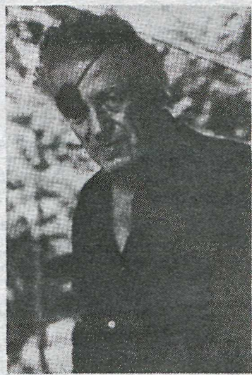
Nicholas Ray leikstjóri Hinna losta-fullu.