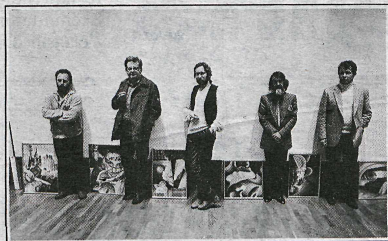
Fimm af „Norðan“-mönnum á Kjarvalsstöðum.