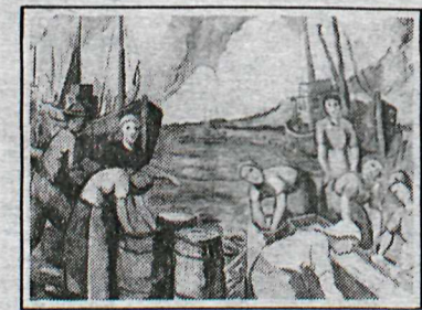
Frá Siglufirði (Málverk frá 1950).

Fjöll okkar frægust, byggjur og bátar og síðarpón – allt túlkað í þeim anda sem upp kemur á leiðinni frá eftirlitningunni, en áður er afstraktið byrjar. Þetta blasir við gesti á stórrí sýningu á verkum Jóns Þorleifssonar sem hefur verið opnuð í Listasafni Íslands.