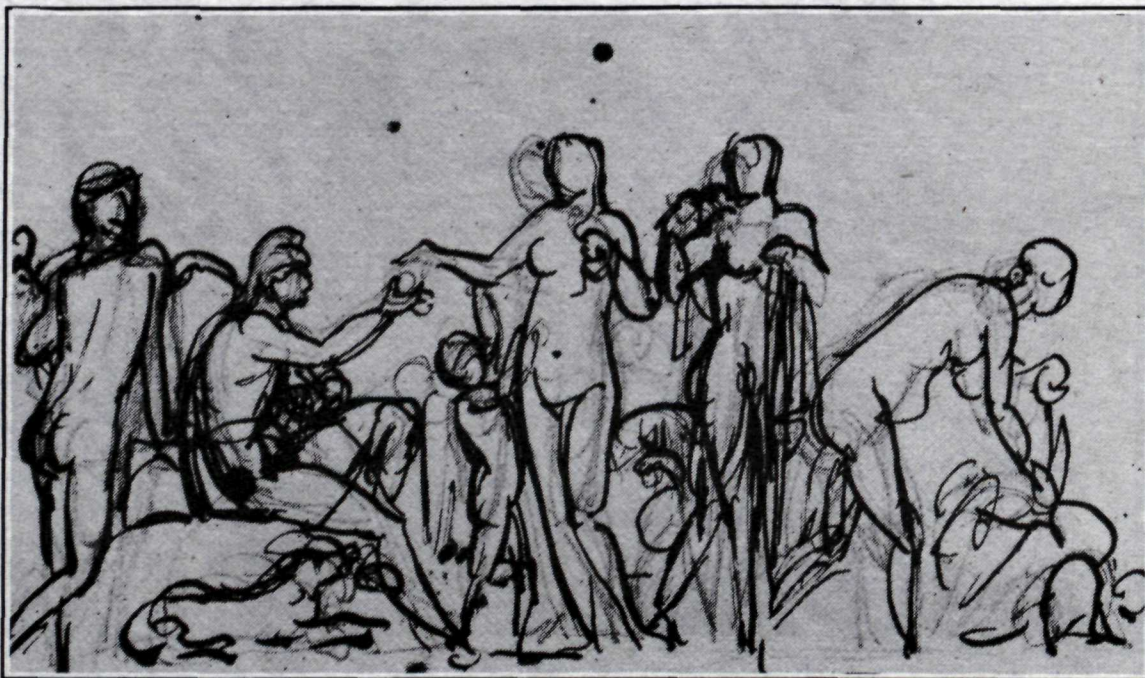
Bertel Thorvaldsen var mjög lifandi í frumríssum sínum svo sem sjá má af þessari teikningu.