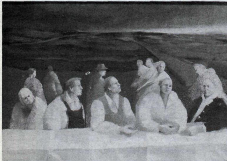
„Þetta er fólk að bíða, ég veit ekki eftir hverju. — Það bara kom til mín og ég setti það á mynd.“