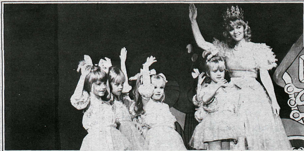
Frá æfingu á Galdrakarlinum.