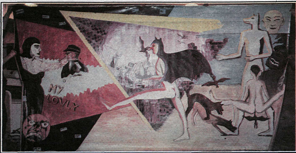
Stórt í sniðum: Myndin er um það bil 2x4 metrar og höfundar hennar sameiginlega eru Helgi Þorgils Friðjónsson og Kristinn G. Harðarson.