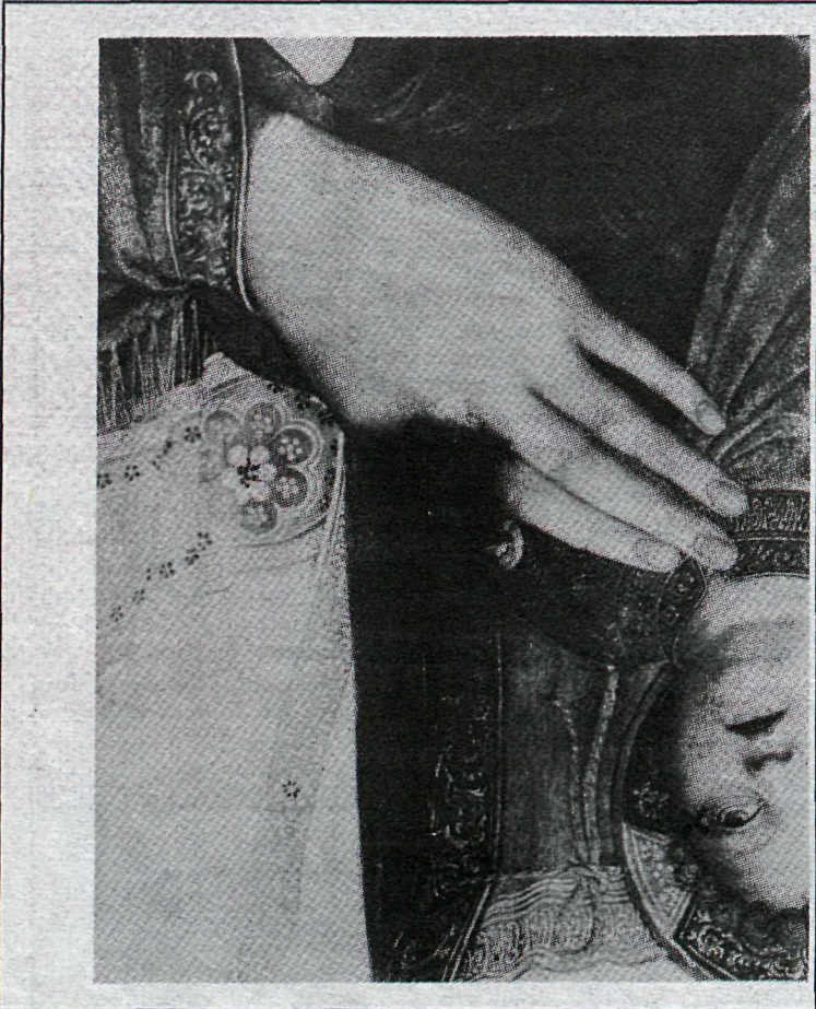
„Cathexis“, 1981. Verk eftir konceptlistamanninn J. Kosuth.