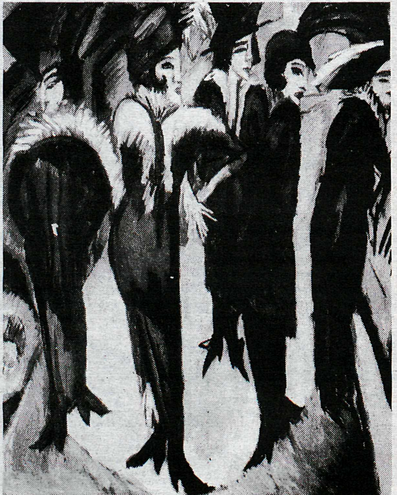
Málverk eftir Þjóðverjann Kirchner frá 1913. Kirchner hefur haft djúptæk áhrif á nýja þýzka málverkið.

Íslenskir listamenn byggja því listaverk sín umfram allt á tilfinningalegri forsendu sem