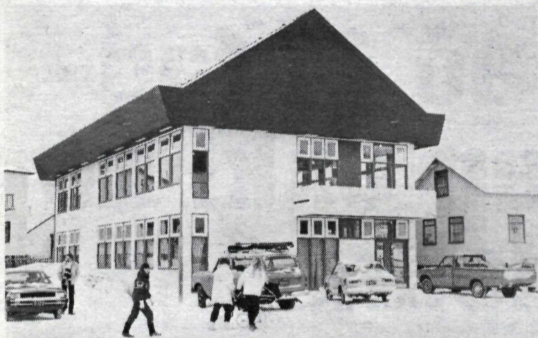
Nýja sparisjóðshúsið á Ólafsfirði.

Auðvitað er það sjálfsagt réttlætsmál að breyta stjórnarskránni og kjördæmaskipaninni, en það eitt breytir engu um efnahagsvandann.“