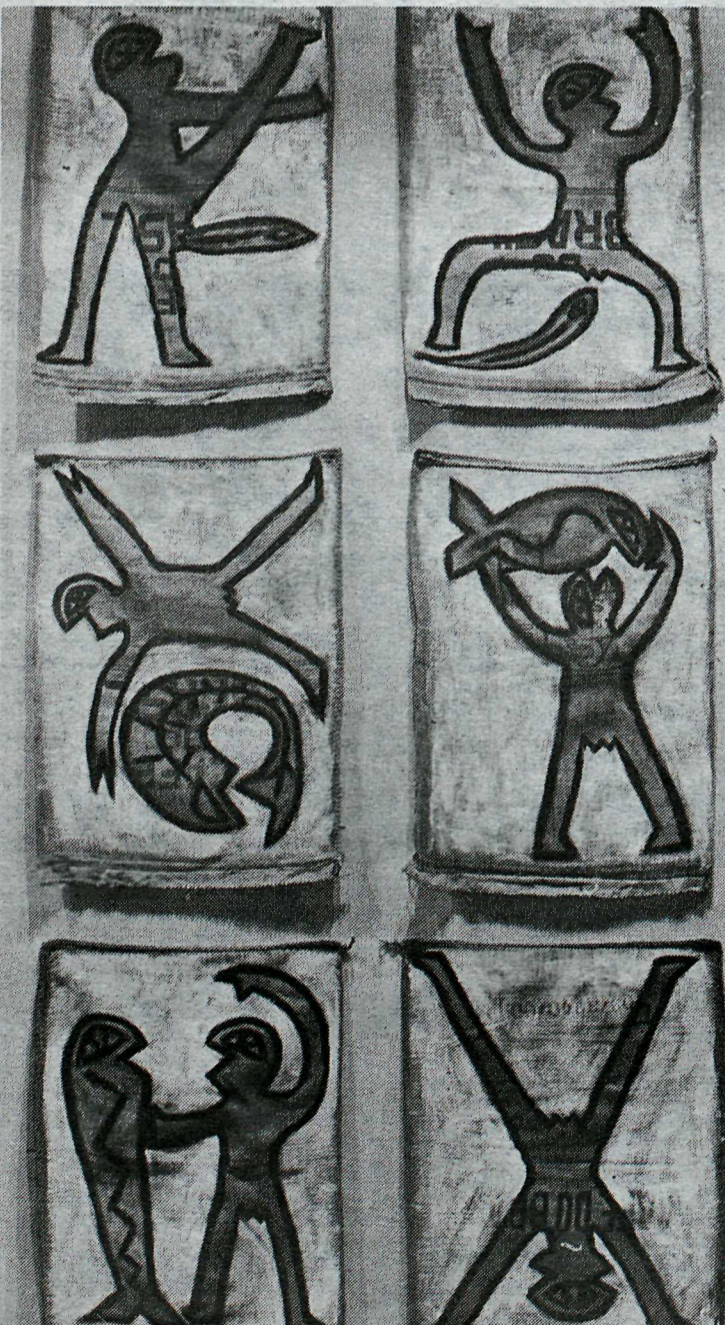
Málverk eftir Erlu Þórarinsdóttur.