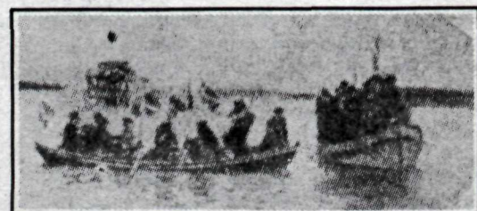
Íslendingar róá út að varðskipinu með bláhvíta fána á lofti, segir í myndatexta þessarar myndar, sem tekin er úr Öldinni okkar.