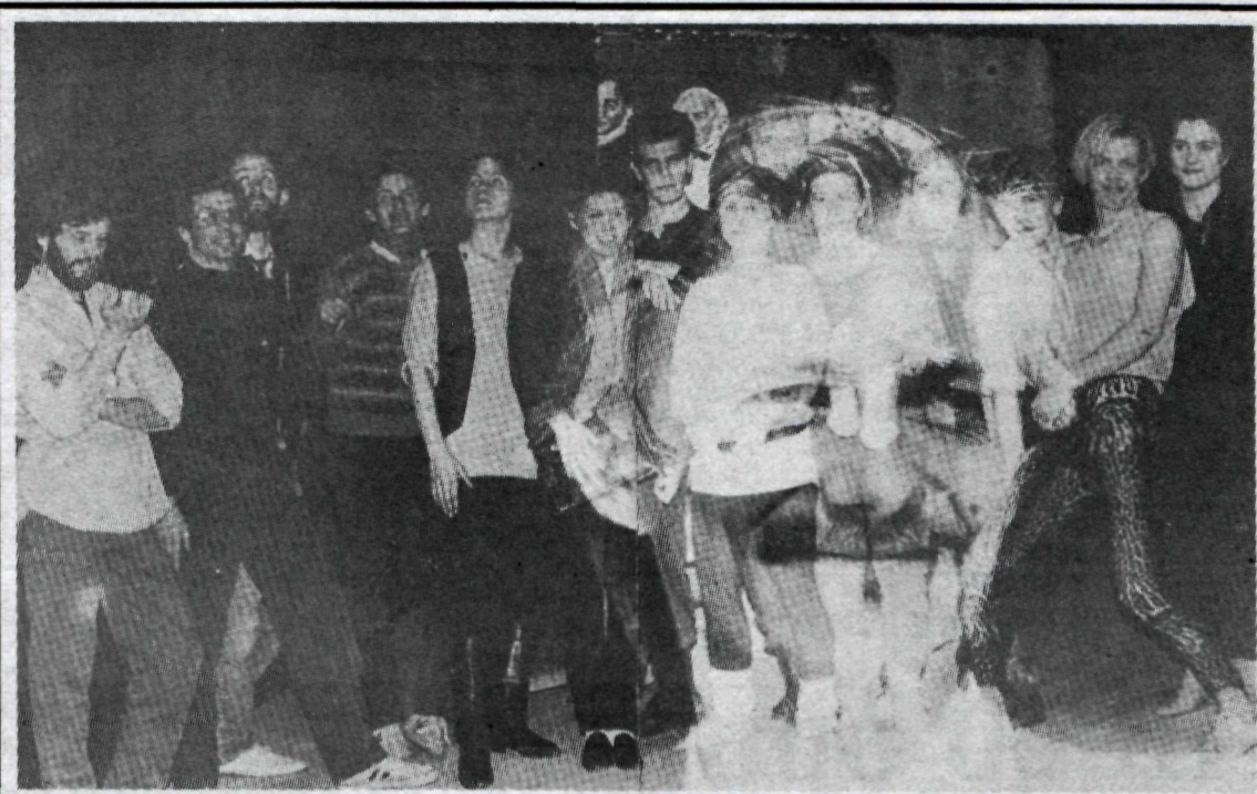
Nýútskrifaður leikhópur Nemendaleikhússins.