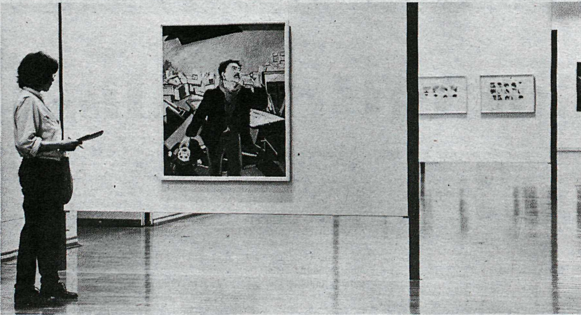
„Morgunn” eftir Sigurð Þóri.

— Og þið eruð bundnir af einni þessari alheimsstefnu, nefnilega nýlistinni. Ég þykist vita að sumir Íslendingar séu ennþá hvekkir út í hana og það er óþarfi að ræða sum viðbrögð við nýlistinni hér svo mjög sem það hefur verið gert áður. En, hvað sem því líður; er nýja málverkið ekki að verða gamalt? „Þetta listform hefur vissulega