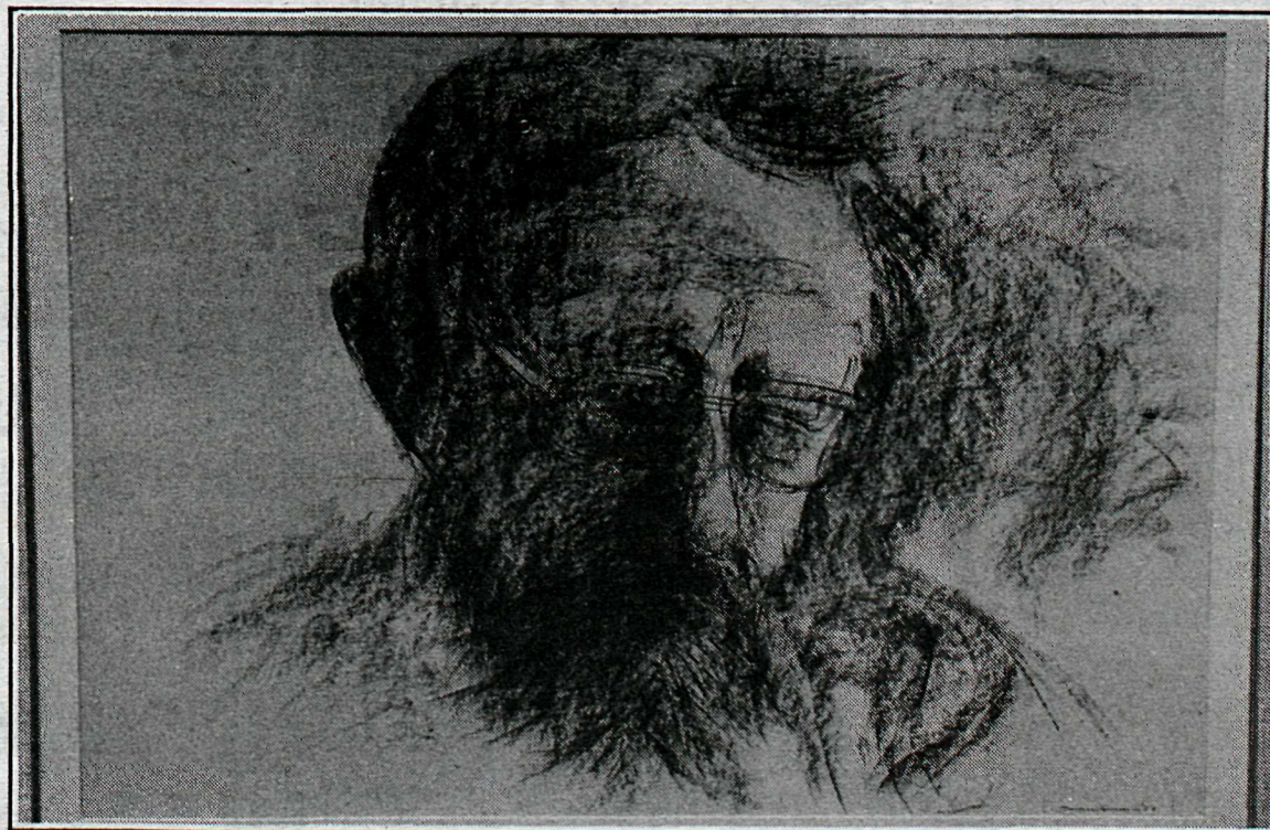
Eitt af portrettum Snorra Sveins Friðrikssonar.