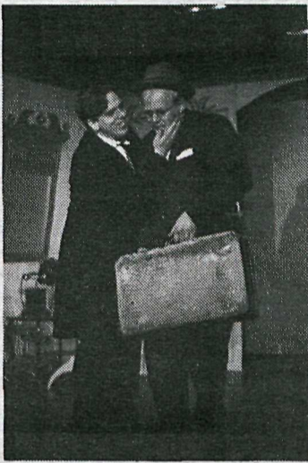
Litla leikfélagið í Garðinum: