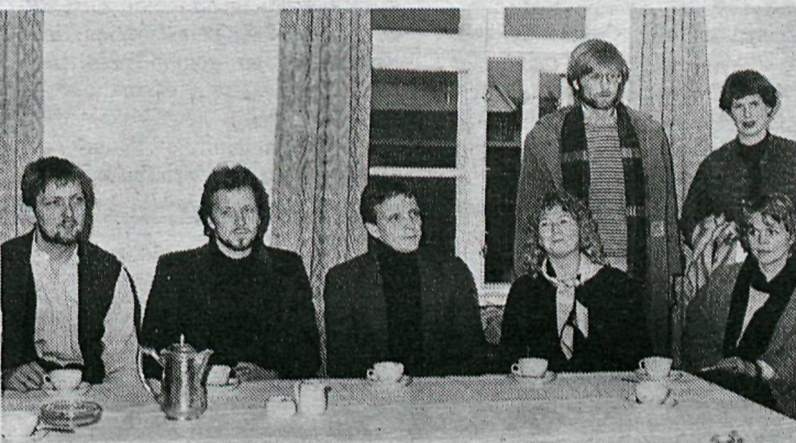
Hér sjást nokkrir þeirra aðila sem munu halda erindi á ráðstefnu Lífs og lands um þjóðarvandamálin um helgina.

Samtökin Líf og land efna til ráðstefnu á Hótel Borg næstkomandi