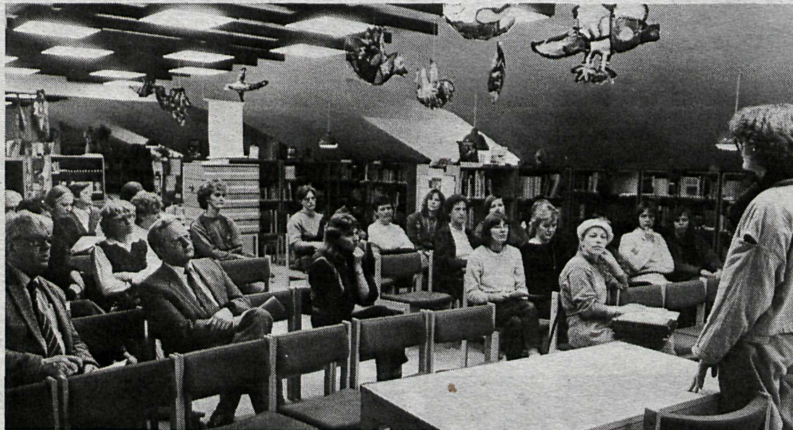
■ Frá fundinum sem skólabókaverðir efndu til í gær í húsnæði bókasafns Langholtsskóla.

Þetta bitnar mjög harkalega á starfi skólanna. Ef við tökum kennslu í Íslandssögu og samfélagsfræðum sem