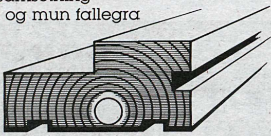
Fúavarið í gegn