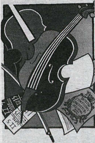
Eitt veggspjaldanna sem er á sýningu Ágústu Ágústsson í Ásmundarsal.

Sýningin stendur til 2. september og er opin daglega frá kl. 13–19 og um helgar frá 13–22. Á myndinni sést Hreggviður við tvö verka sinna.