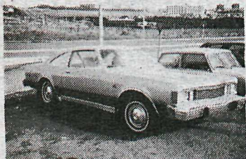
Plymouth Volaré Coupé '80

6 cyl., sjálfsk. í gólfi, vökva-stýri, útvarp, ekinn aðeins 55.000 km, sumar- og vetrardekk, skipti á ódýrari.