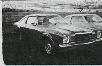
Plymouth Volaré Road Runner '76

6 cyl., sjálfsk., vökva- og veltistýri, rafdrifnar rúður og skottlok, litað gler, útvarp, sumar- og vetrardekk, læst drif o.fl. aukahlutir. Stórglæsilegur lúxusbíll. Skipti á ódýrari.