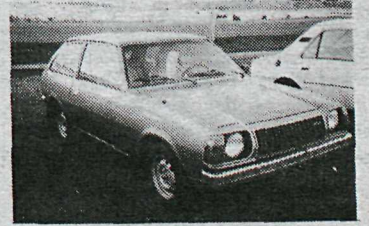
Mazda 323 '77

Ekinn 80.000 km, 6 cyl., sjálfsk. Gamall og harður jaxl sem bregst þér varla í vetur.