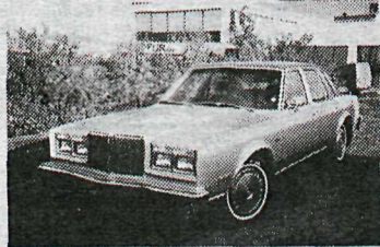
Chrysler Le Baron Medallion '81

6 cyl., sjálfsk. í gólfi, vökva-stýri, útvarp, ekinn aðeins 55.000 km, sumar- og vetrardekk, skipti á ódýrari.