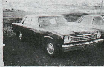
Plymouth Valiant '75

V8 318 cub., ekinn 60.000 mílur. Huggulegur bíll með fjölda aukahluta. Gott ástand, skipti á ódýrari.