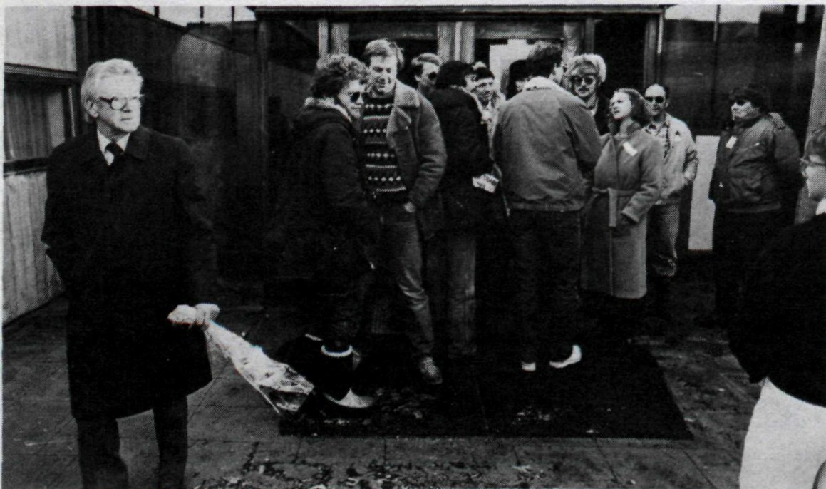
Vonsviknum boðsgesti vísað frá Kjarvalsstöðum af verkfallsvörðum BSRB.

Nú verður sýningin formlega opnuð á vegum Kjarvalsstaða. Ég er mjög þakklát stjórn Kjarvalsstaða fyrir velvild í minn garð í þessu máli og að lokum vil ég bera kveðju mína og þakklæti öllum þeim sem mættu við þessa sögulegu opnun um síðustu helgi og vona að þeir láti sjá sig aftur, en sýningin stendur til 18. nóvember,“ sagði Steinunn að lokum.