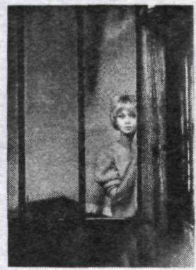
TÍU FRANSKIR LJÓSMYNDARAR