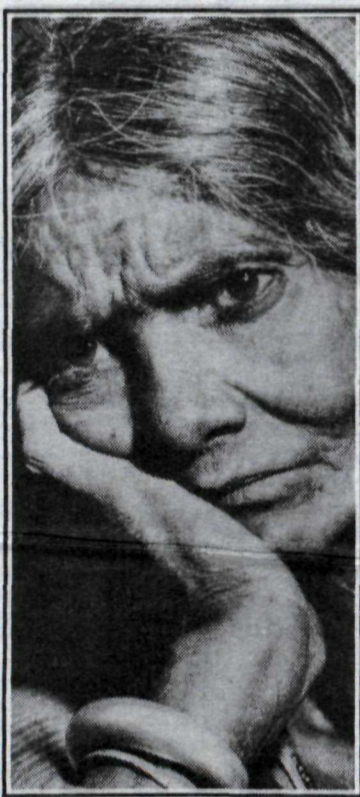
„Svipur syrgjandi konu“ eftir Margaret Bourke-White.