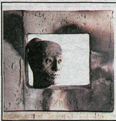
Horft á rigningu.

Mínar hugmyndir standa oftast í sambandi við fólk — bæði hinn ytri og innri mann. Kannski þó öllu meira þann innri. Ég vona að það sjáist, að það er verið að tjá einhverjar kenndir og að þetta eru a.m.k. stundum myndir með sálrænu inn-taki. Líkaminn — þá gjarnan kvenlíkam-