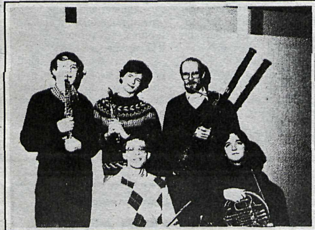
■ Blásarakvintett Reykjavíkur