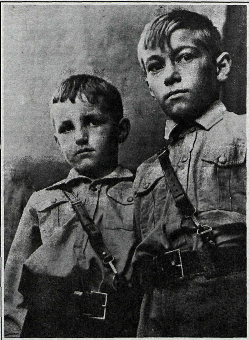
■ Þessi mynd er tekin árið 1932 og sýnir tvo unga drengi í Moravíu sem tilheyra hinni svokölluðu „Hitlers æsku“.