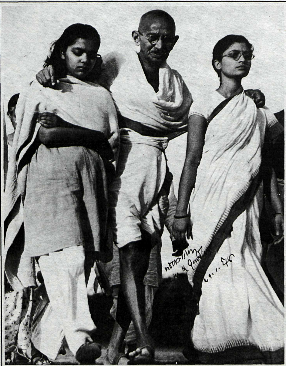
■ Margaret Bourke White kynntist Gandhi náð á ferðum sínum um Indland og tók myndir af leiðtoganum sem eru merkilegar heimildir. Hér er Gandhi ásamt barnabarni sínu og frænku.