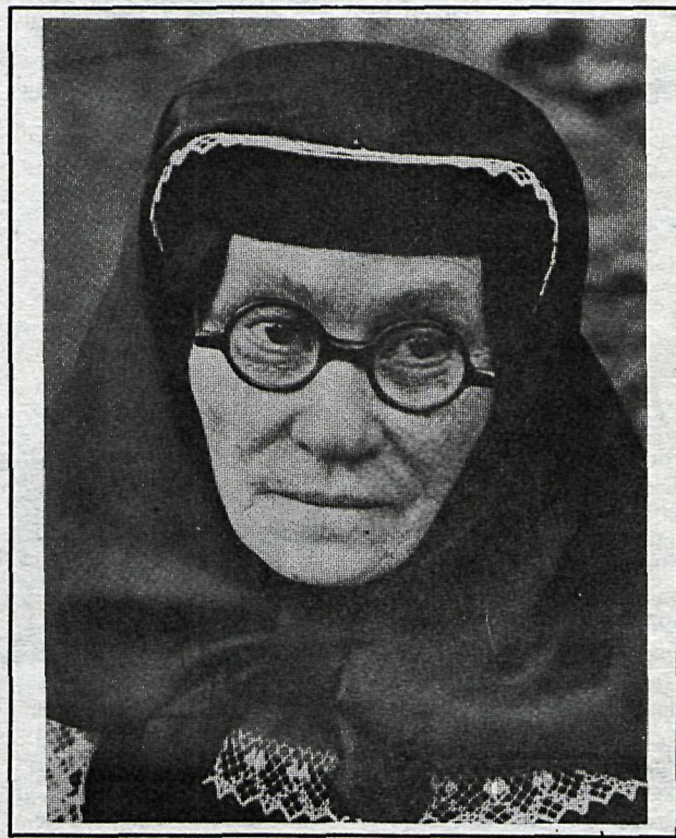
■ Á einni af ferðum sínum til Sovétríkjanna hitti White móður Stalíns og myndaði hana á heimili sínu. „Ég hafði það á tilfinningunni að þessi kona hefði verið óvenju lagleg sem ung kona. Andlit hennar bar með sér mikinn persónuleika.“