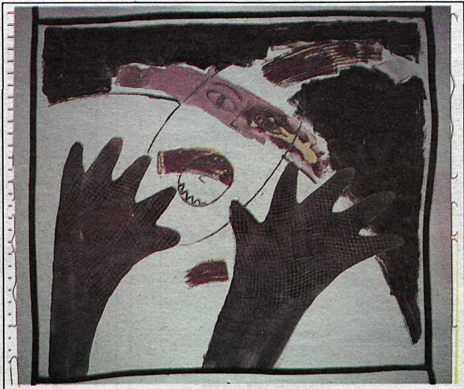
■ Lísbet Sveinsdóttir: „Gler heillar mig fyrir það hve tært það er.“