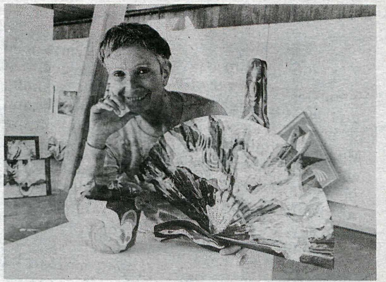
Blævaengur. Því miður njóta bjartir og fjörlegir litir þessara verka sín lítt í svarthvítu.

konar verk; málverk, silkiverk sem ég sýni nú í fyrsta sinn á Íslandi og litirnir eru þeirrar náttúru að það má þvo verkin. Eg er afskaplega heppin með