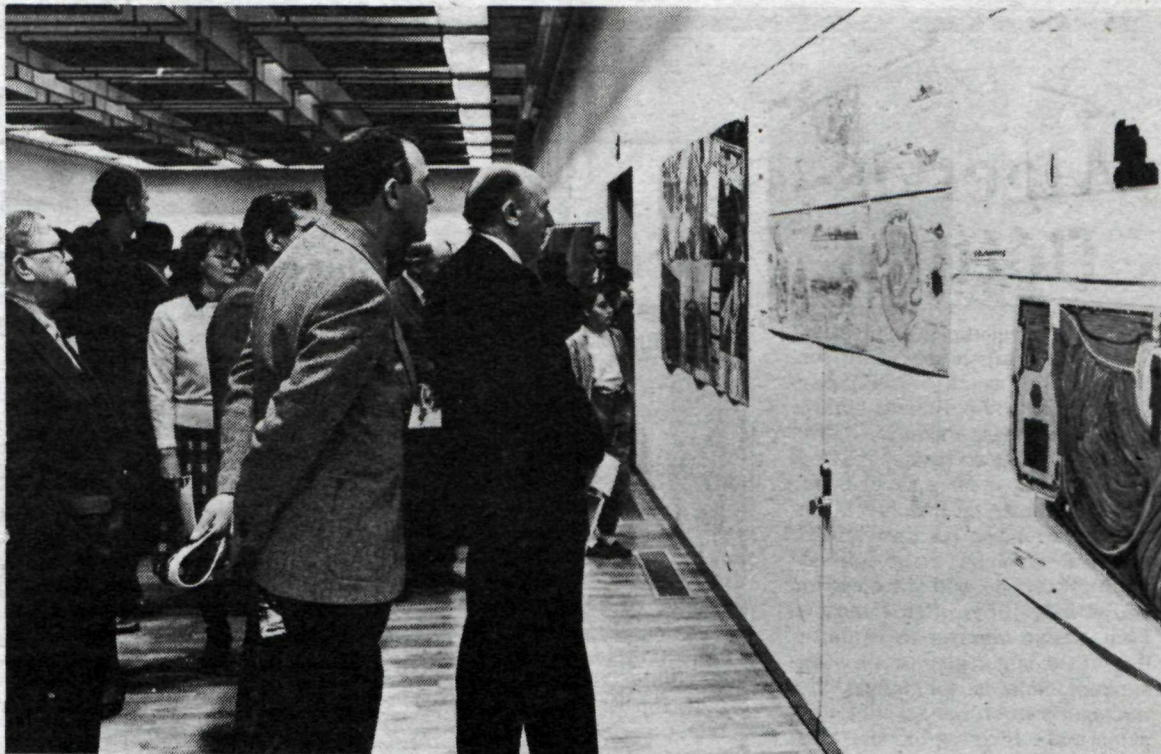
Frá opnun sýningarinnar á Kjarvalsstöðum í gær.