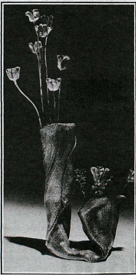
Steinblómið — einnig unnið fyrir Glit.

— „Stundum kviknar góð hugmynd,“ sagði hann. „Hönnunin tekur skamman tíma, hluturinn er einfaldur í framleiðslu og selst vel. Handunna oliukolan okkar sem unnin er í steinleir er gott dæmi um stykki, sem notið hefur fádæma vinsælda. Hún hefur nú þegar selst í meira en