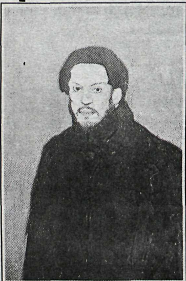
21. Sjálfsmynd. Barr.