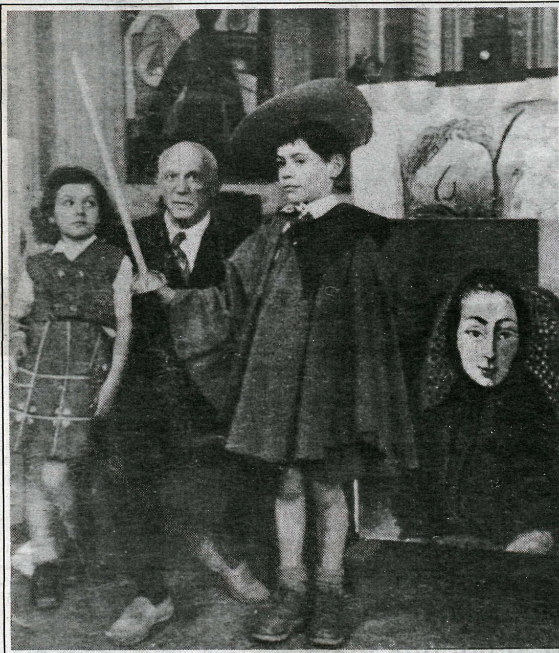
Picasso ásamt Palomu og Claude.