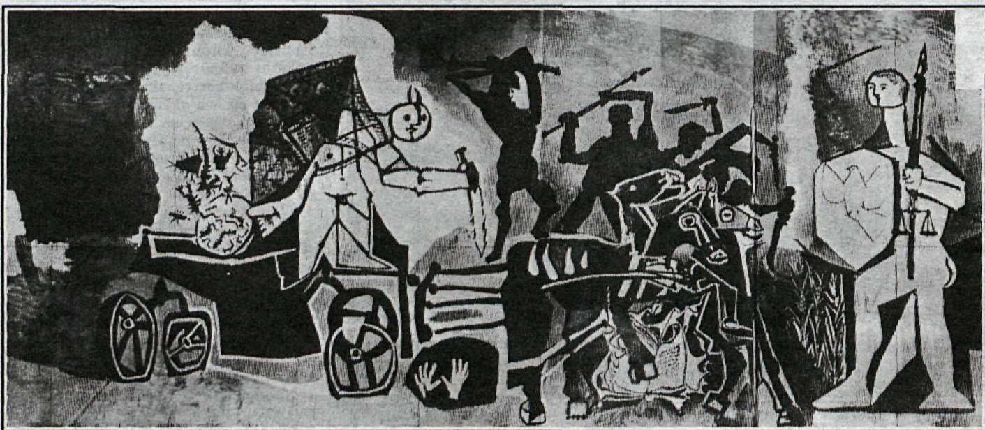
Hryllingur styrjalda og hvernig þær bitna á saklausu fólki var eitt af viðfangsefnum Picassos. Hér er mynd um slíkt efni: Stríð og friður, 1952. Af sama toga er hin fræga mynd, Guernica.