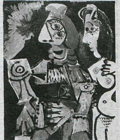
Picasso - Spænsk par, 1970, oila á striga.

einungis takmarkaða hugmynd um andrúki Picassos og lífsgleði. Við njótum kannski sýningarinnar best með því að fara eins nálægt síðustu myndum hans og lögreglan leyfir, og lofa augunum að reika eftir litflekjunum, rákunum og strokunum, sem ganga fram og aftur eftir striganum í ofsa-fengnum dansi.