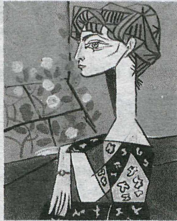
Picasso - Frú Z, 1954, oila á striga.

Lífi og starfi Picassos hefur oftast einu sinni verið líkt við þjóðarþrótt Spánverja, nautaat (nú síðast í nýrri sjónvarpsmynd). Nautaatíð var honum sjálfum tákn fyrir lífshákann,