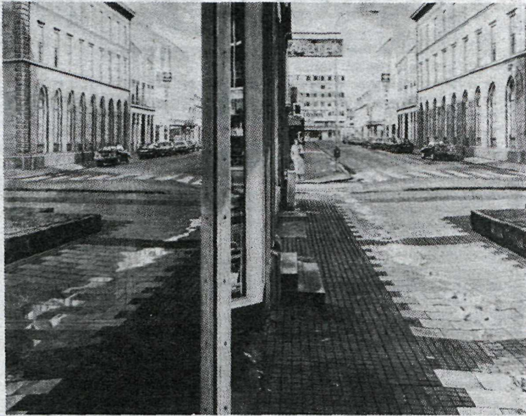
„Austurstræti“ 1980 — eftir Gunnar Karlsson.

Það væri mjög nærri lagi að álykta, að myndlistarmenn hafi misskilið boðið og haldið, að hér væri eins konar áttahagsýning í uppsiglingu. Ýmsir hafa t.d. sagt við undirritaðan, að þeir hefðu tvímælalaust sent inn myndir, ef sýningin hefði verið auglýst undir skýrari formerkjum. Í ljós kemur, að sennilega hafa þessar vangaveltur verið óþarfar, því að ýmsir, sem fá inn myndir á sýninguna, taka einfaldlega þátt í framkvæmdinni sem reykviskir myndlistarmenn en hafa ef til vill breytt nöfnum á myndum til heiðurs borg og byggð. En þá kemur upp úr kafinu, að sýningargestir margir hverjir skilja sýninguna á svipaðan hátt og þeir, sem halda að sér hönd-