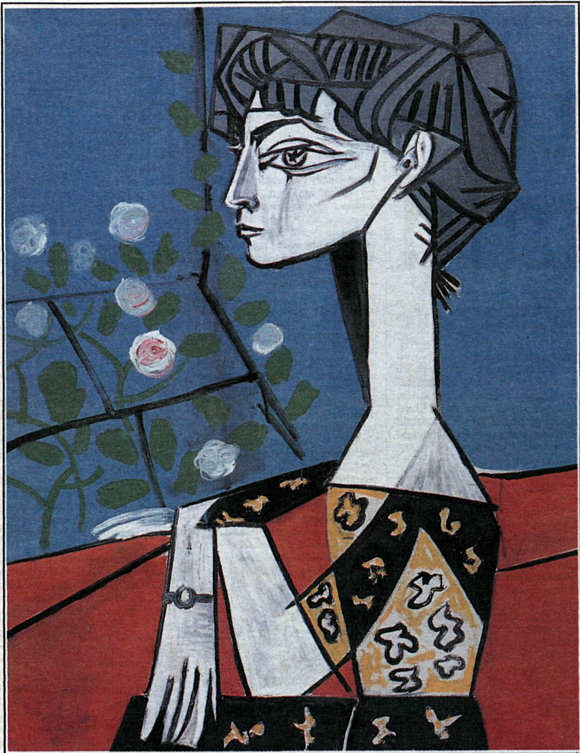
Frú Z (1954), olía á striga.