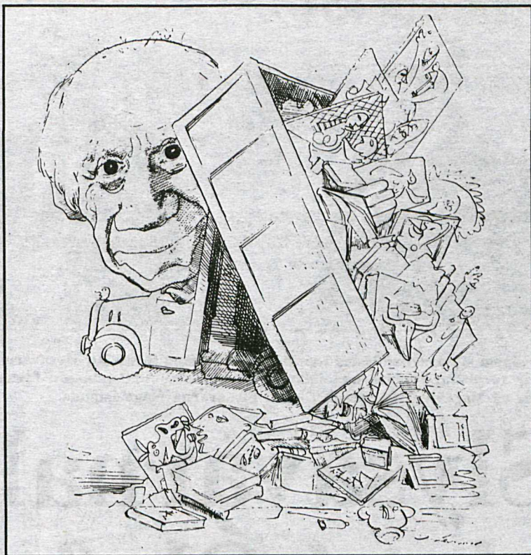
Picasso í strikum David Levine.

mínar myndir yrðu brenndar, held ég, að ég myndi samt sem áður mála, já ég myndi halda áfram að mála.“ Samtímis hinni risastóru sýningu á verkum Picassos, í Grand og Petit Palais var hinni stóru mynd Braque af vinnustofunni komið fyrir í Louvre. Á þeim tíma voru hinir tveir forvínir orðnir ósættanlegir andstæðingar.