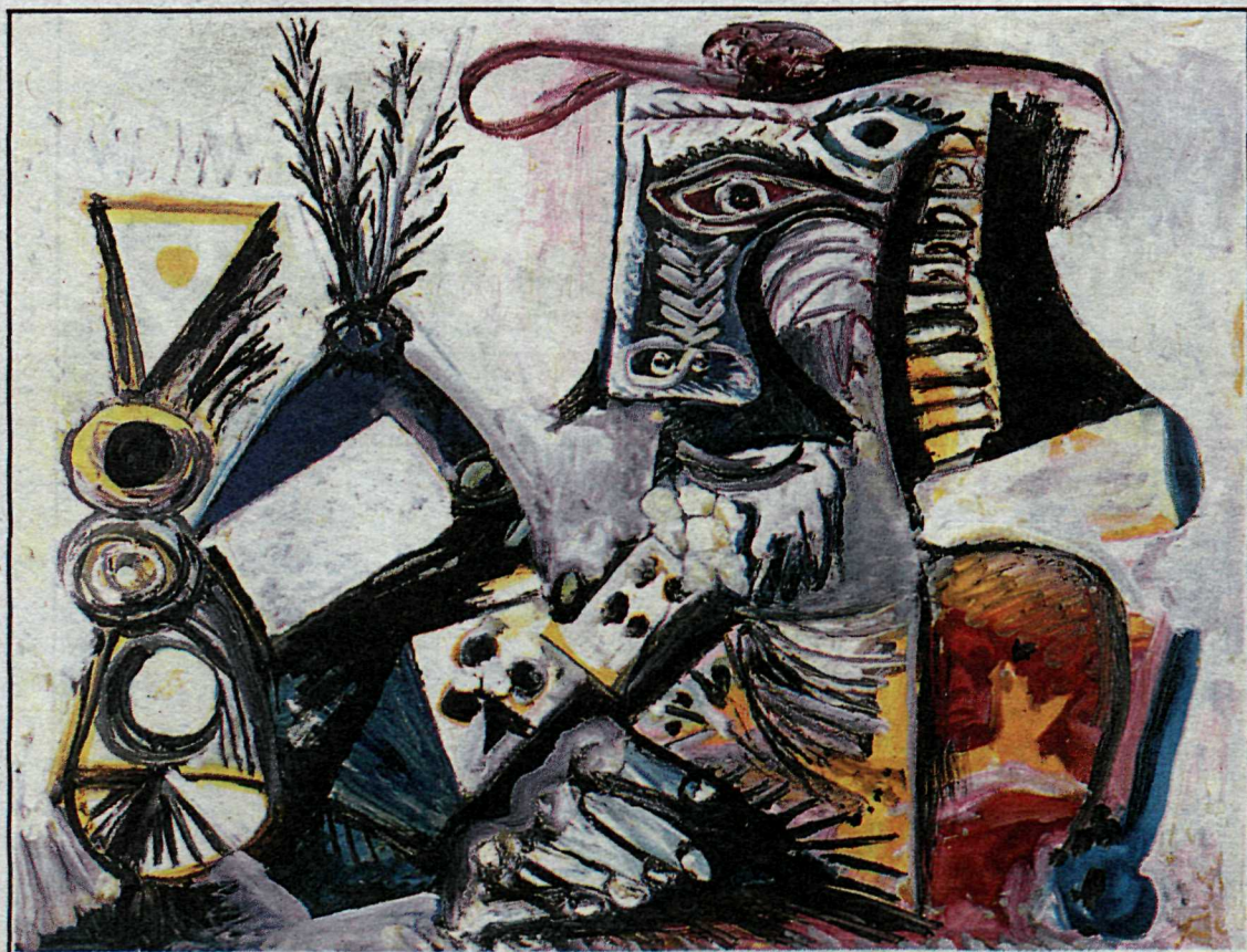
Spilamaðurinn — olía á striga 1971