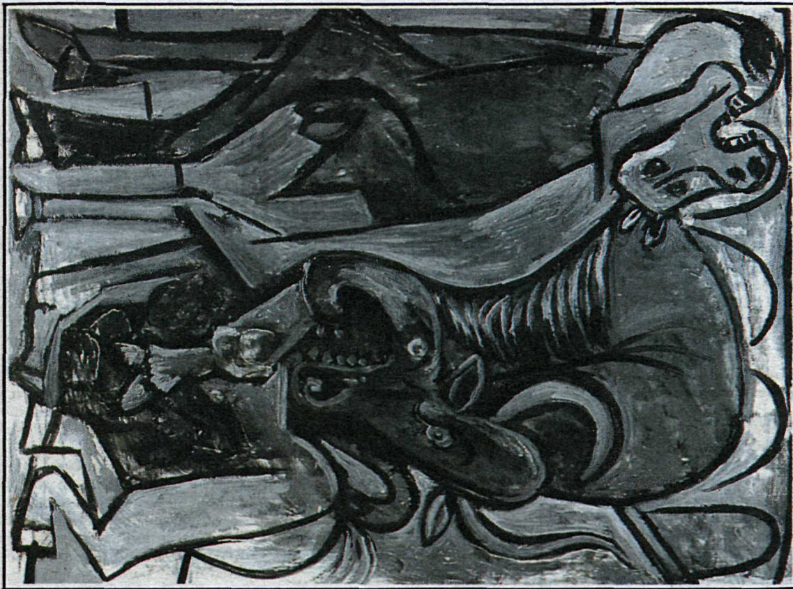
Nautaat — olía á striga 1934