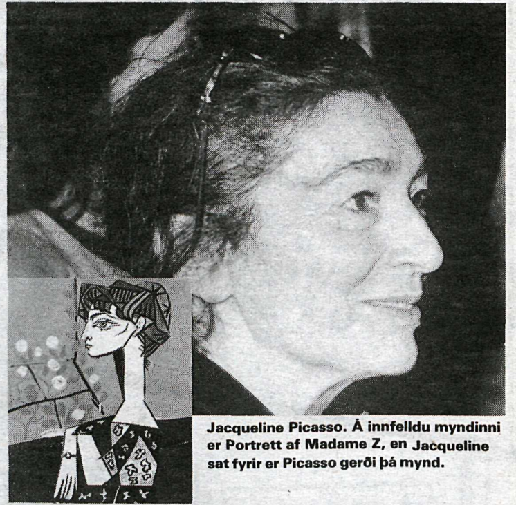
Jacqueline Picasso. Á innfelldu myndinni er Portrett af Madame Z, en Jacqueline sat fyrir er Picasso gerði þá mynd.