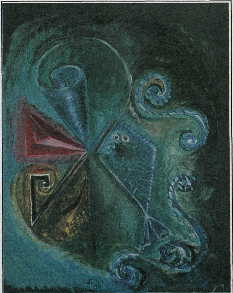
Fiskur, 1986. Blönduð tækni.

„Nei,“ afdráttarlaust. „Og þó. Það er kannski í þeim einhver vottur af abstrakt-hugsun — abstrakt í bland við sýmbólisma. Gallinn er bara sá að kringum bæði abstraktið og sýmbólisma voru reist heil trúarbrögð og af þeim vil ég ekkert vita. Mér finnst ég vera miklu skyldari sýmbólisma á borð við André Masson. Nú — það er búið að þvæla mikið um nýja málverkið, en ég er vitanlega hluti af því. Reyndar málaði ég mikið af abstraktverkum áður en ég fór í Myndlista- og handiðaskólann '76; þetta voru svona lýrisk abstraktverk. En