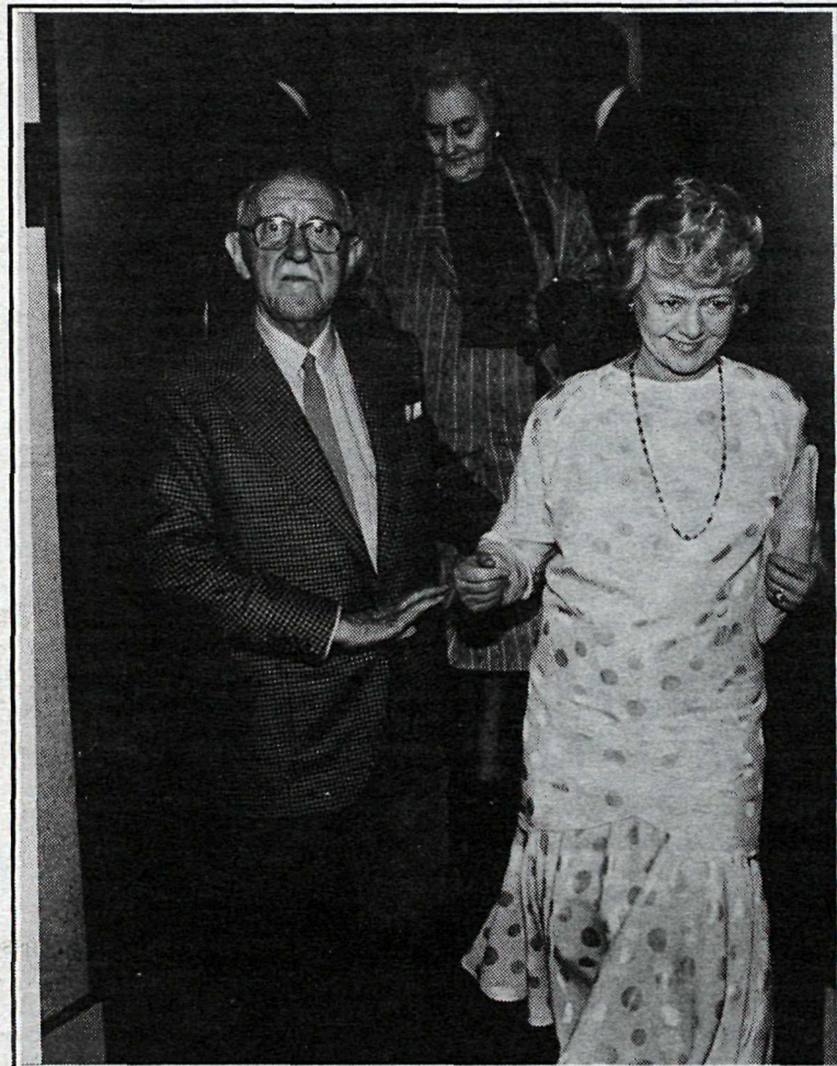
Halldór leiðir frú Vigdís Finnbogadóttur forseta Íslands. Frú Auður Laxness gengur á eftir þeim.