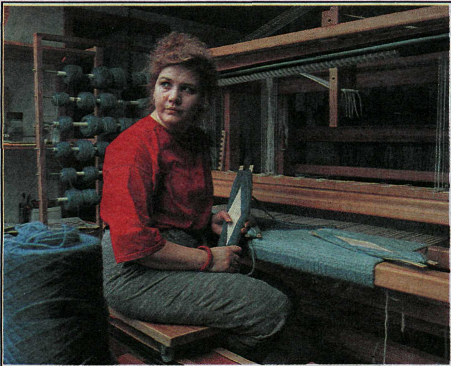
Ljós.