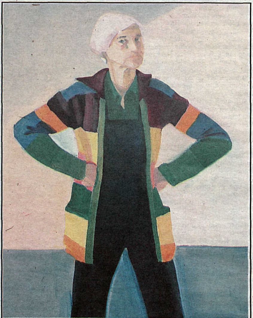
Sjálfsmynd eftir Louisu Matthíasdóttur