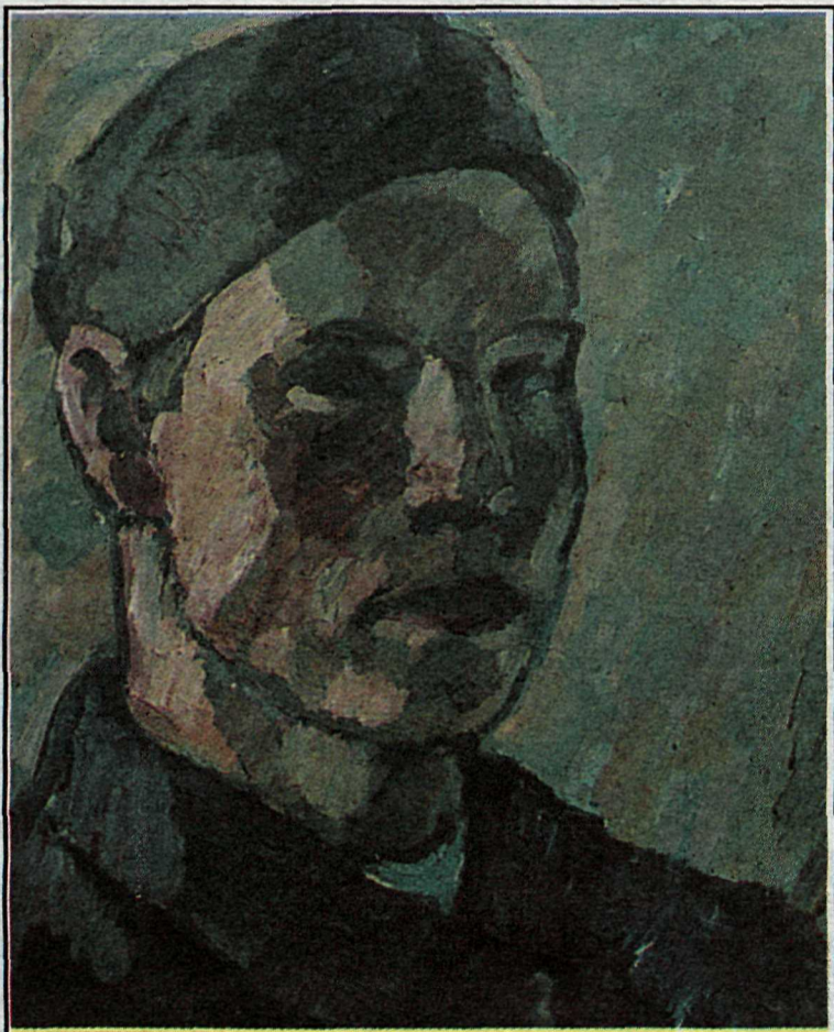
Sjálfsmynd eftir Gunnlaug Scheving