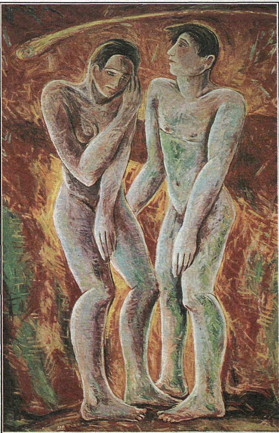
Paradísarauðn. 1987. 200x140 sm.

Ég var í grafík á þessum skólaárum '74 til '78 og þegar ég kem heim stunda ég hana dálítið en fer fljótlega að einbeita mér að málverkinu. Tek það alveg fyrir eins og ég hafði gert með móldeikningu og grafík. Fer að einbeita mér að litnum, forminu og innihaldinu líka.