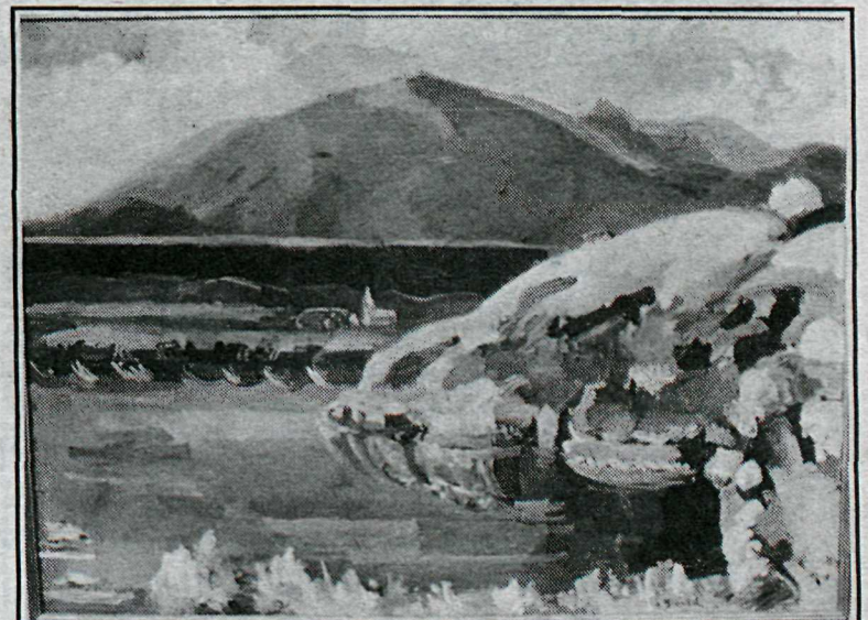
Þessi Þingvallamynd eftir Gunnlaug Blöndal er meðal þeirra verka sem boðin verða upp á Hótel Borg á sunnudaginn. Lágmarksverð myndarinnar er 250.000 krónur.