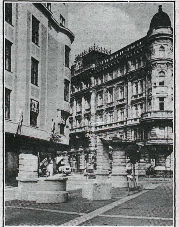
„Time Concrete,“ frá sýningu í Helsinki 1986. Steinsteypa. Gert með hliðsjón af byggingu við austurenda götunnar. Stærð: 5X13 metrar, hæð 4.5 metrar

Seinna var ég eitt ár í Kaupmannahöfn. Eitt sinn hittumst við nokkrir listamenn í eldhúsinu hjá