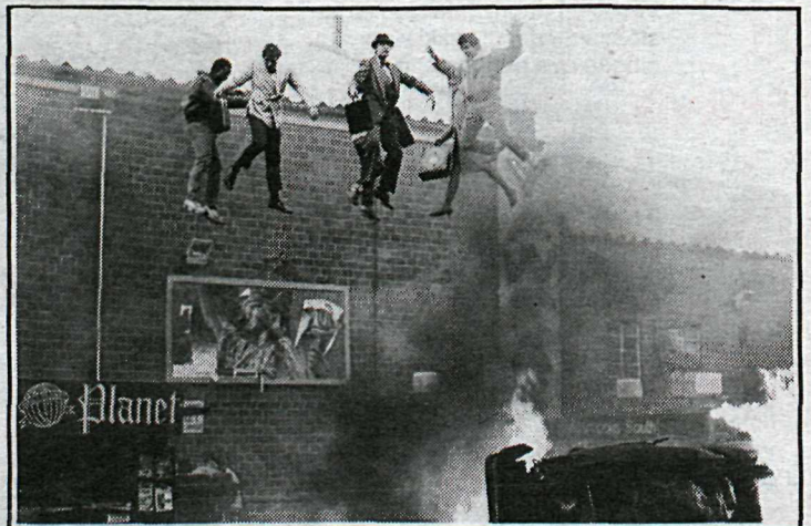
Vegfarendur fá að finna fyrir ofurkrafti Kjarnorkumannsins, andstæðings Súpermans, í nýjustu myndinni um stálmennið fljúgandi.

Reeve, sem keppir við Sean Connery um titilinn „Sá sem oftast hefur sagt aldrei skal ég leika hann aftur“, mun hafa heimtað raunveruleikann í myndina og framleiðendurnir Golan og Globus, sem gátu ekki hugsað sér að finna nýjan Súperman, kinkuðu kalli við öllu sem hann sagði, meira að segja þegar hann bað um að fá að leika í annarri mynd á þeirra vegum. Svo Reeve klæddist skikkjunni aftur en er þreytulegur eins og gamanið sé löngu búið. Gene Hackman er ennþá glæpakóngurinn Lex Luthor sem skapar Kjarnorkumanninn til höfuðs Súperman; Margot Kidder er ennþá kærasta Súpermans á hinni Daglegu plánetu; Mariel Hemingway er kærasta Clark Kents sem gefur tækifæri til kómískra bragða af hálfu Súpermans og Jon Cryer er frændi Hackmans en kemst lítið að. Tónlistin er eftir