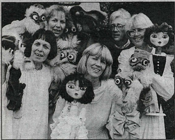
Aðstandendur Leikbrúðulands ásamt brúðum er notaðar eru í Mjallhvít.

Frumssýning verður í kvöld kl. 20.00 og önnur sýning á sunnudaginn á sama tíma.