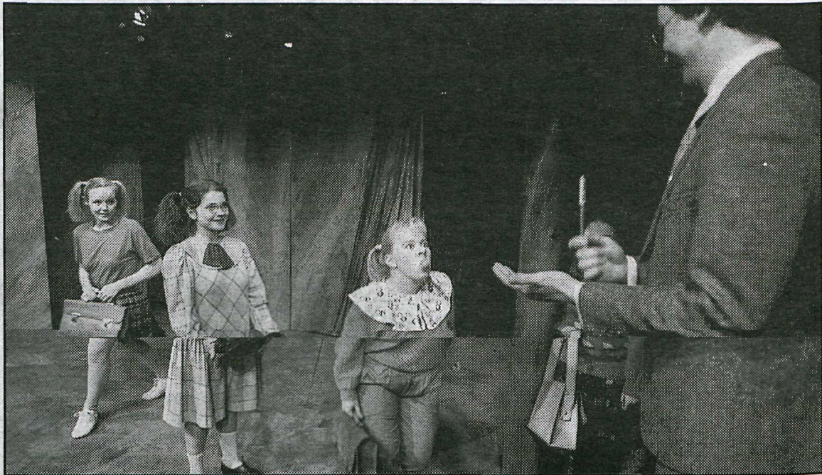
Atriði úr Hundheppinn.

Mér fannst afleitt hversu leikararnir fá misjöfn tækifæri í þessu