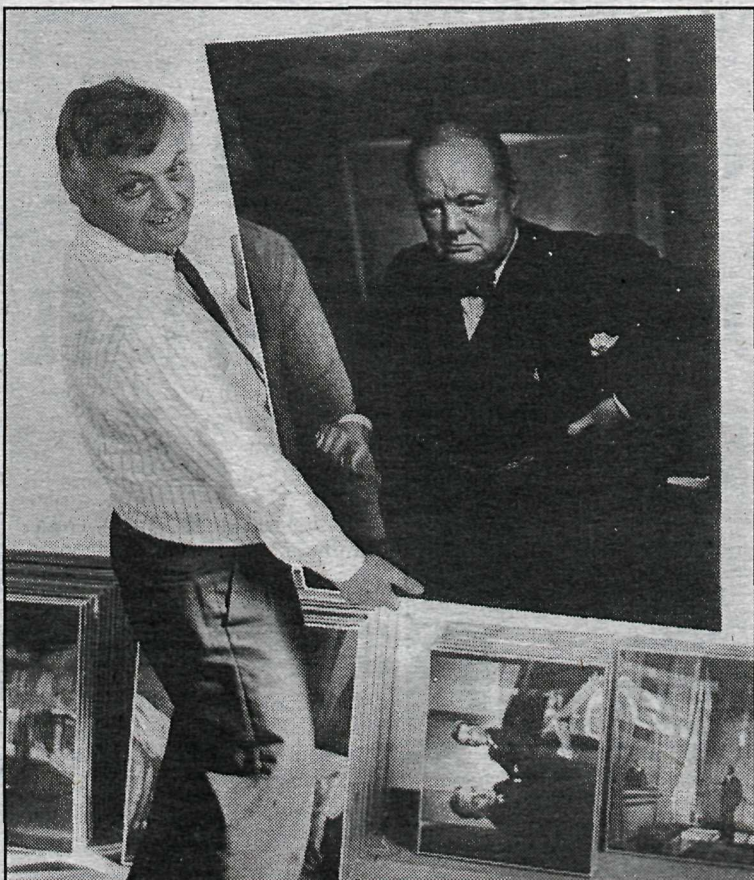
Þessi mynd af Churchill þar hróður höfundarins víða. Sá heitir Yousuf Karsh. Sýning á verkum hans stendur nú yfir á Kjarvalsstöðum.

Sýningin, sem nú er á Kjarvalsstöðum, er afmælisýning í tilefni áttæðisafmælis höfundarins. Það er Ljósmyndarafélag Íslands sem gekkst fyrir því að fá hana hingað til lands. Sýningin er opin kl. 11-18 alla daga og lýkur 30. júlí.